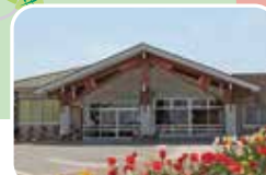
ひまわり保育園/約1,700m