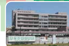
あさひ総合病院/約1,900m