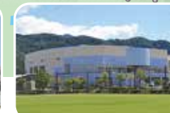
文化体育センター/約1,400m