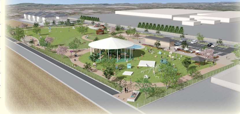
※泊駅南公園イメージ図