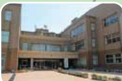
さみさと小学校/約1,500m